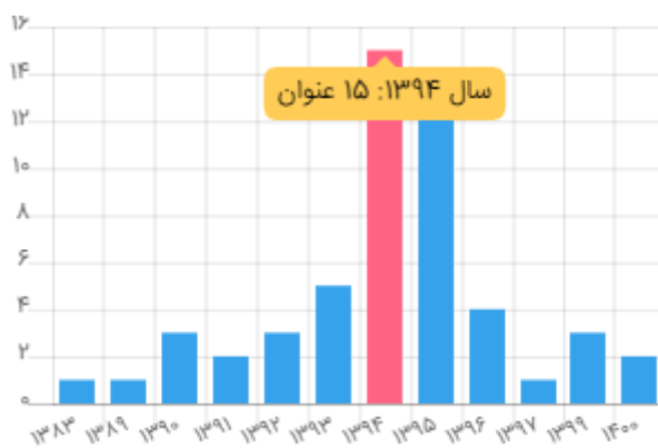
شکل ۱. تعداد مقالات طی سال ۱۳۸۳-۱۴۰۰.