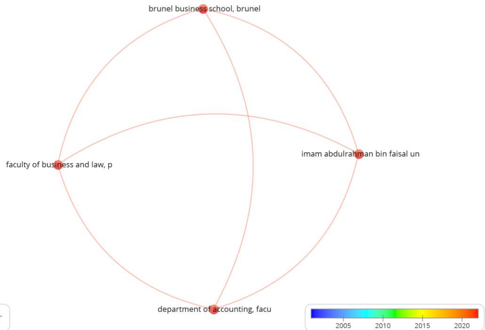
شکل ۲: نقشه ی همپوشانی همکاری سازمان ها در تولید مقاله

از ۹۱ سازمان ، ۶۸ سازمان حداقل ۲ و حداکثر ۵ استناد در مقالات خود دریافت نموده بودند که از میان آنها ۴ سازمان با یکدیگر همکاری فعال داشتند. نقشه ی همپوشانی فعالیت آنان به شکل بالا رسم شد و چنانچه قابل مشاهده است با توجه به قرمز بودن رنگ نقشه، همکاری آنان پس از سال ۲۰۲۰ قوت گرفته است. در زیراسامی این سازمان ها ارایه شده است: