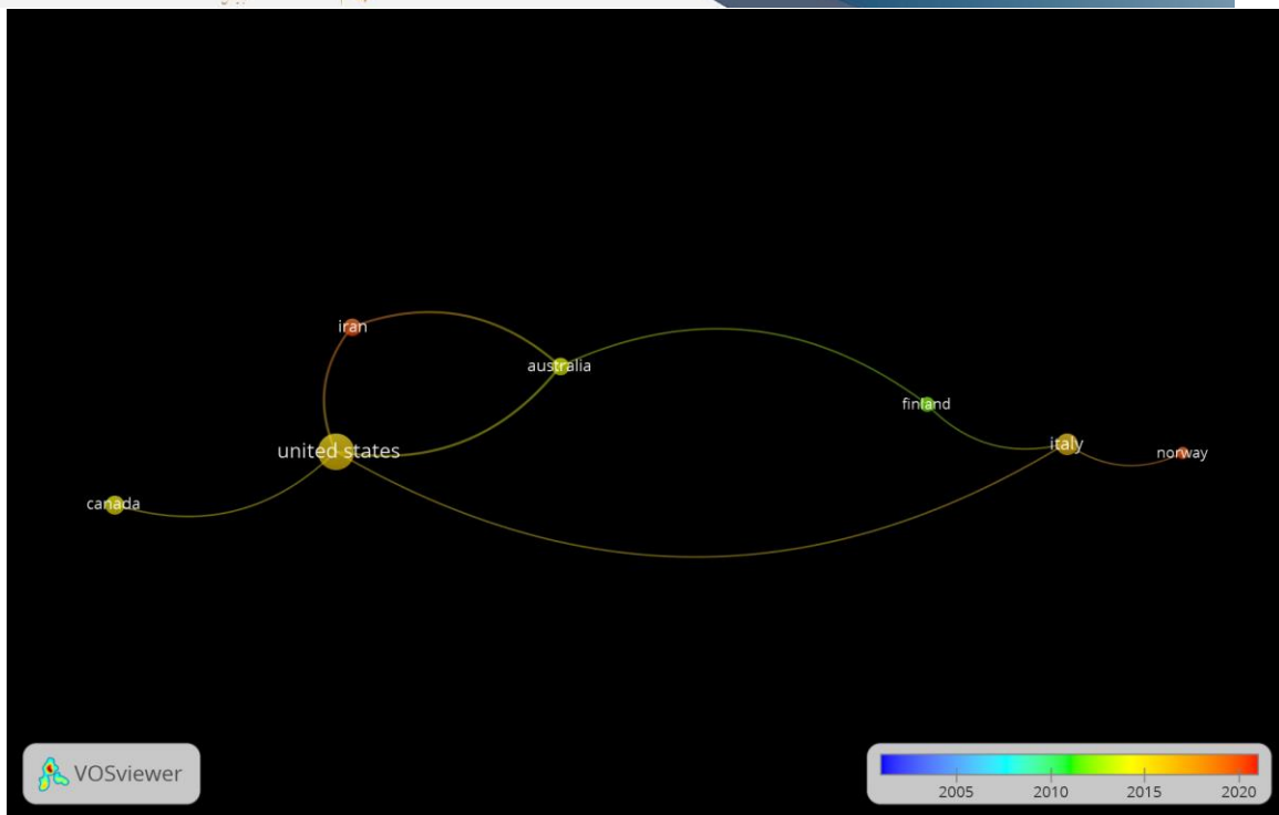
شکل ۳. نقشه ی همکاری بین المللی نویسندگان

در میان ۵۸ سند استخراج شده از پایگاه اسکوپوس، ۷ کشور یافت شدند که با یکدیگر در زمینه ی مبانی و تئوری های بودجه ریزی عملیاتی شرکت داشته اند. رنگها، اندازه ی دایره ها و طول پیوندها در این قسمت نقش تعریفی دارند، بدین معنی که هرچه قدر رنگ پیوندها از آبی به قرمز نزدیک شود این معنی را میرساند که زمان همکاری جدید تر بوده، هر چه قدر دایره بزرگ تر باشد یعنی تعداد اسناد تولیدی بیشتر بوده و هرچه قدر طول پیوند ها کوتاه تر باشد یعنی آن کشور ها با یکدیگر همکاری نزدیک تری داشته اند. در تصویر مشاهده می شود که میزان همکاری کشورها به ترتیب با یکدیگر چگونه بوده است: